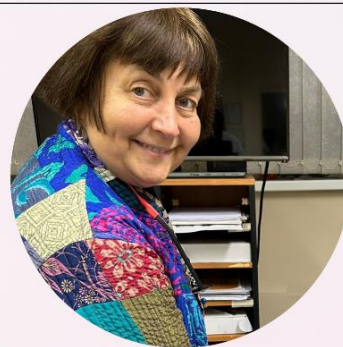
Pasniedzēja - profesionāla māksliniece un pedagoge